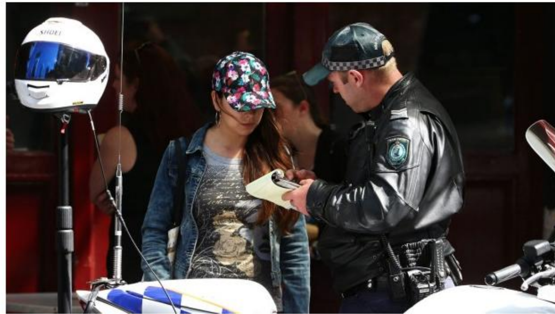
A police officer talks to a pedestrian in the Sydney CBD.

More than 10,000 pedestrians have been fined for illegally crossing city streets since a crackdown was launched against the practice in Sydney's CBD, new figures have revealed.