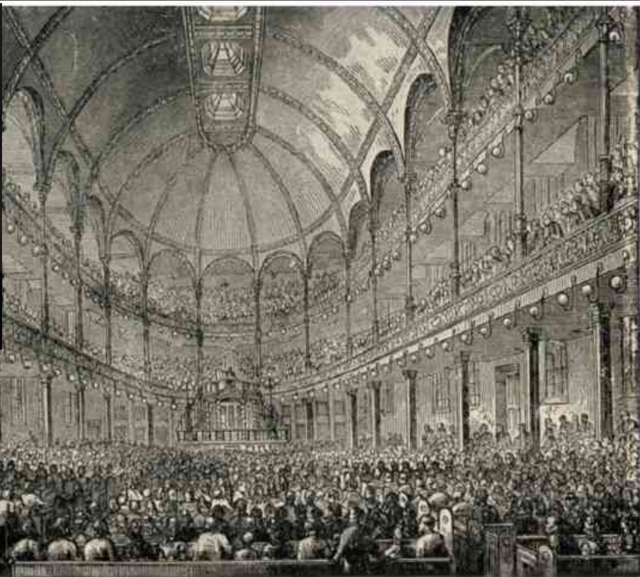
INTERIOR VIEW OF THE METROPOLITAN TABERNACLE.